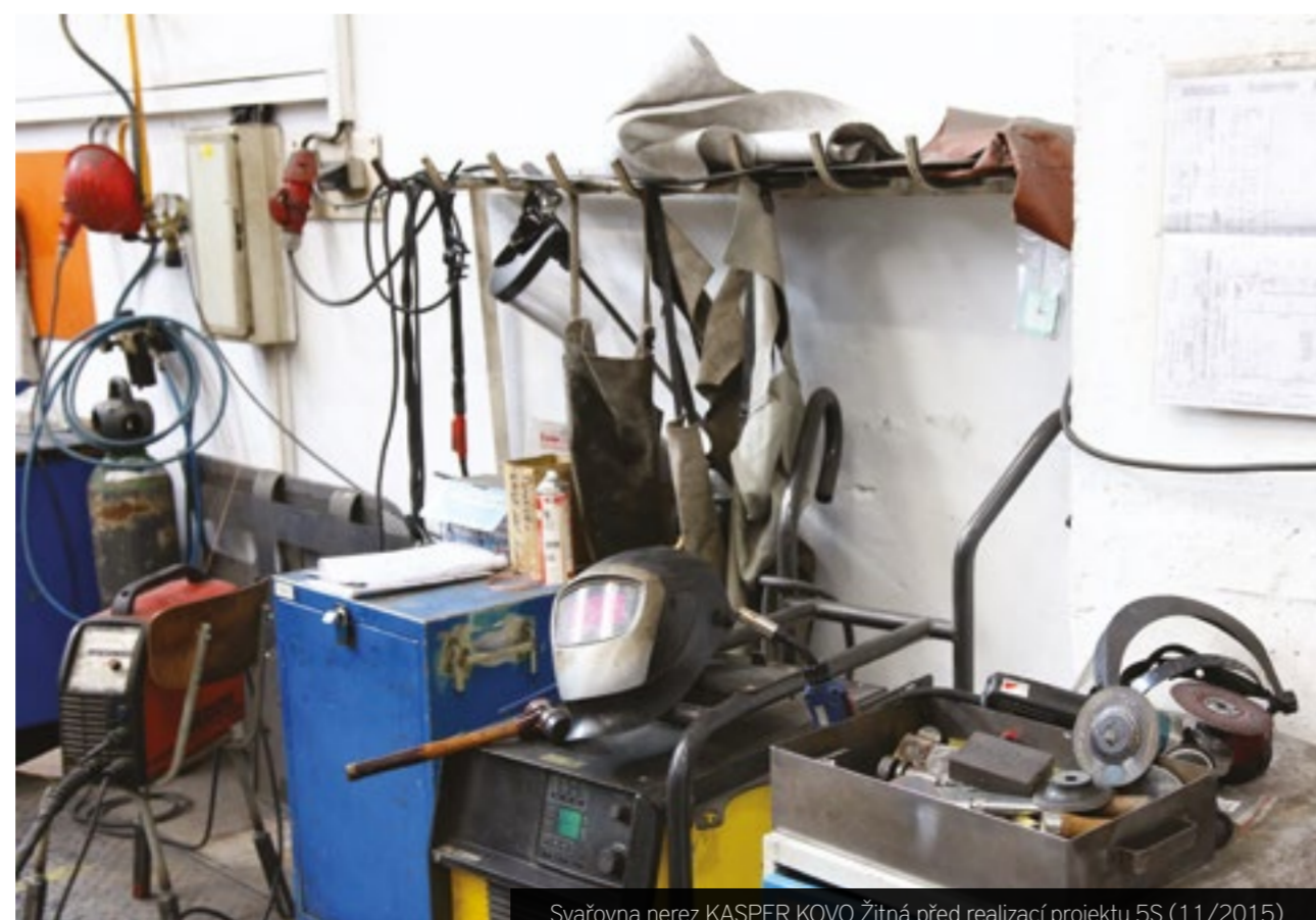
Svařovna nerez KASPER KOVO Žitná před realizací projektu 5S (11/2015)